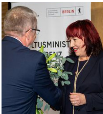
KMK-Generalsekretär Udo Michalik gratuliert Senatorin Astrid-Sabine Busse

Ein weibliches Führungstrio leitet die Geschicke der Kultusministerkonferenz (KMK) im Jahr 2023. Astrid-Sabine Busse, Berliner Senatorin für Bildung, Jugend und Familie, folgt im Amt der KMK-Präsidentin auf die Ministerin für Allgemeine und Berufliche Bildung, Wissenschaft, Forschung und Kultur des Landes Schleswig-Holstein, Karin Prien, die nun 2. Vizepräsidentin ist. Zur 1. Vizepräsidentin wird Ministerin Christine Streichert-Clivot aus dem Saarland, welche im nächsten Jahr den Vorsitz übernimmt.